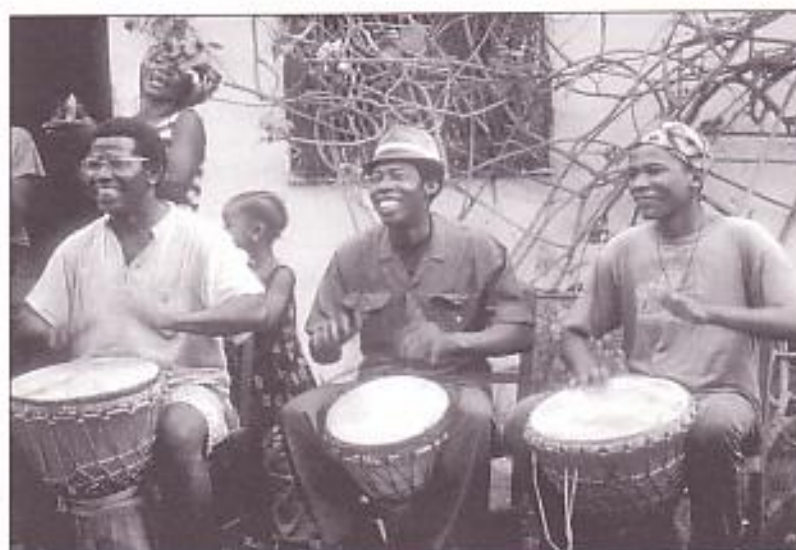
Djembé-Spieler in Afrika